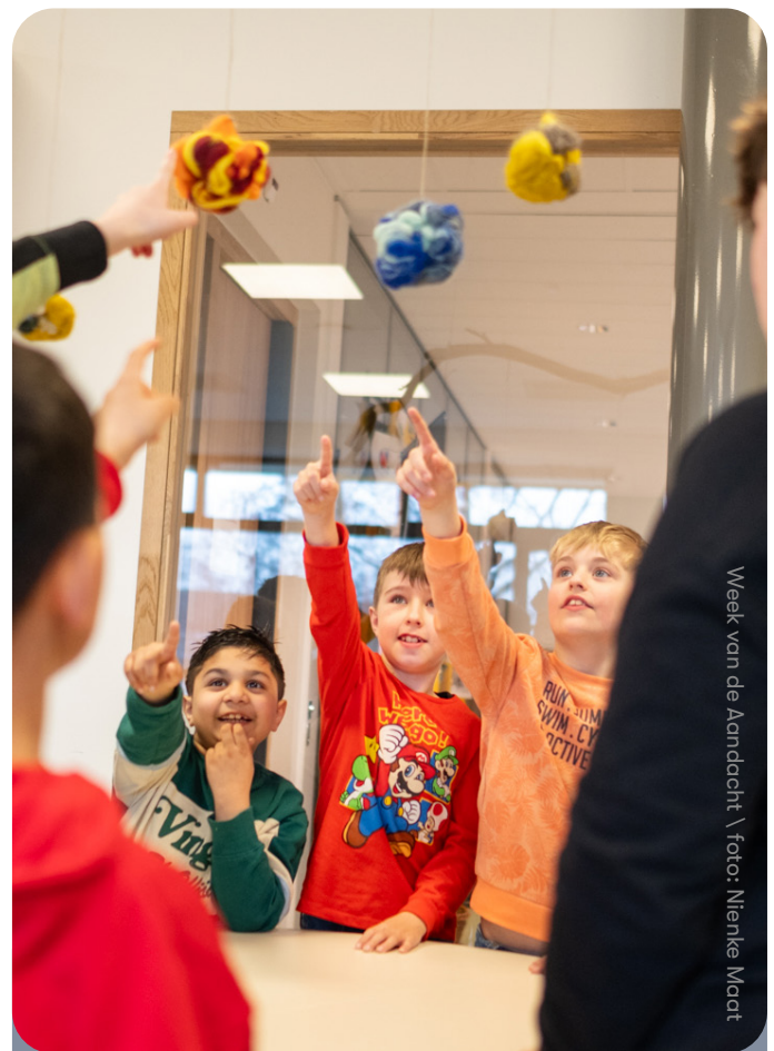
Week van de Aandacht

Door samen te werken met Jonx (jongeren GGZ Delfzijl), Noorderpoort Appingedam (zorg & welzijn), Cadanz (maatschappelijk werk Delfzijl) en Luna Care (opvang & dagbesteding), konden we jongeren bereiken die anders nauwelijks met cultuur in aanraking komen. Hun medewerkers waren onmisbare schakels: zorgvuldig contact leggen en afstemmen kostte veel tijd, maar bleek cruciaal om vertrouwen te winnen.