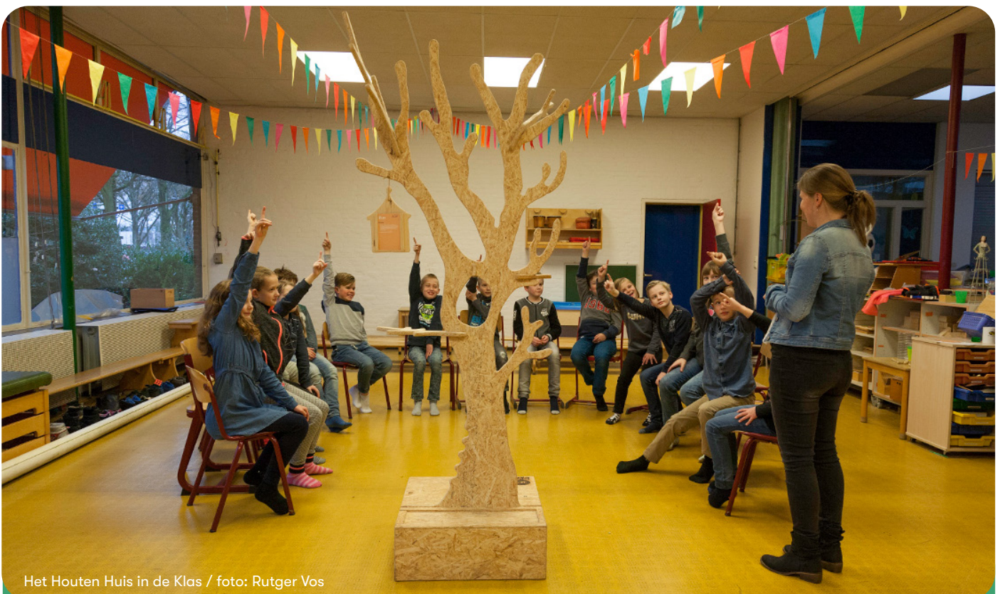
Het Houten Huis in de Klas

Daarnaast waren ze betrokken bij het ontwikkelen van het educatief materiaal voor onze nieuwe voorstelling Hou Vast , die op dit moment speelt.