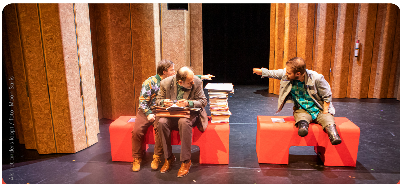
Als het anders loopt

Voor de voorstelling Als het anders loopt , die in 2025 in reprise ging en 55 keer heeft gespeeld voor 12.195 bezoekers, werkte regisseur Elien van den Hoek met een acteur met het syndroom van Down, een acteur met een dwarslaesie en een acteur zonder armen en benen. We zien het werken met zo'n diverse spelersgroep als een leerzame en verrijkende ervaring voor het gezelschap, voor alle deelnemende acteurs maar ook voor het theaterveld en voor het publiek.