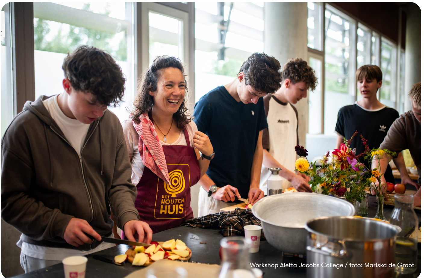
Workshop Aletta Jacobs College

We verzorgden een theaterworkshop voor de startbijeenkomst van het team van basisschool de Wegwijzer in Groningen. We namen hen in verschillende groepen mee in onze wereld van theatermaken. De leerkrachten gingen aan de slag met een schimmendoek, objecten en audio om zo te kijken hoe ze zelf verschillende theatervormen kunnen gebruiken in de Gouden Weken.