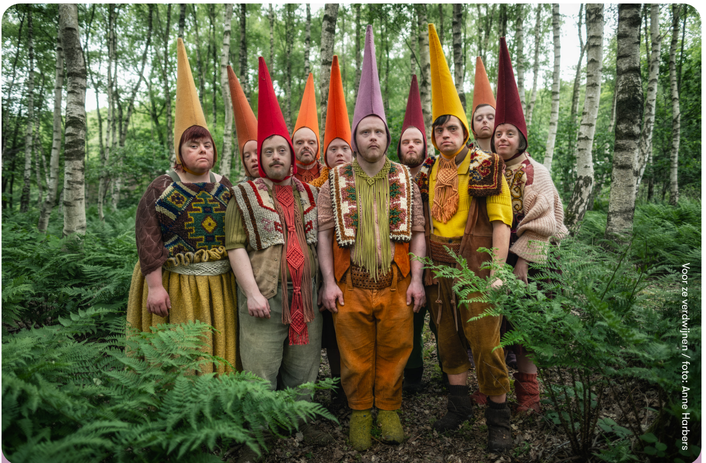
Voor ze verdwijnen

We staan nog steeds voor grote uitdagingen: de sterk stijgende kosten voor producten en personeel. Meer subsidiegeld betekent niet meer spelen, maar dekking voor de prijsstijgingen. Dat is voor een gezelschap uitdagend, want ons doel is spelen voor zoveel mogelijk mensen. Toch gaan we vol vertrouwen de uitdagingen aan met ons nieuwe plan voor 2025-2028. We kijken ernaar uit om weer veel kinderen te inspireren en te verwonderen.